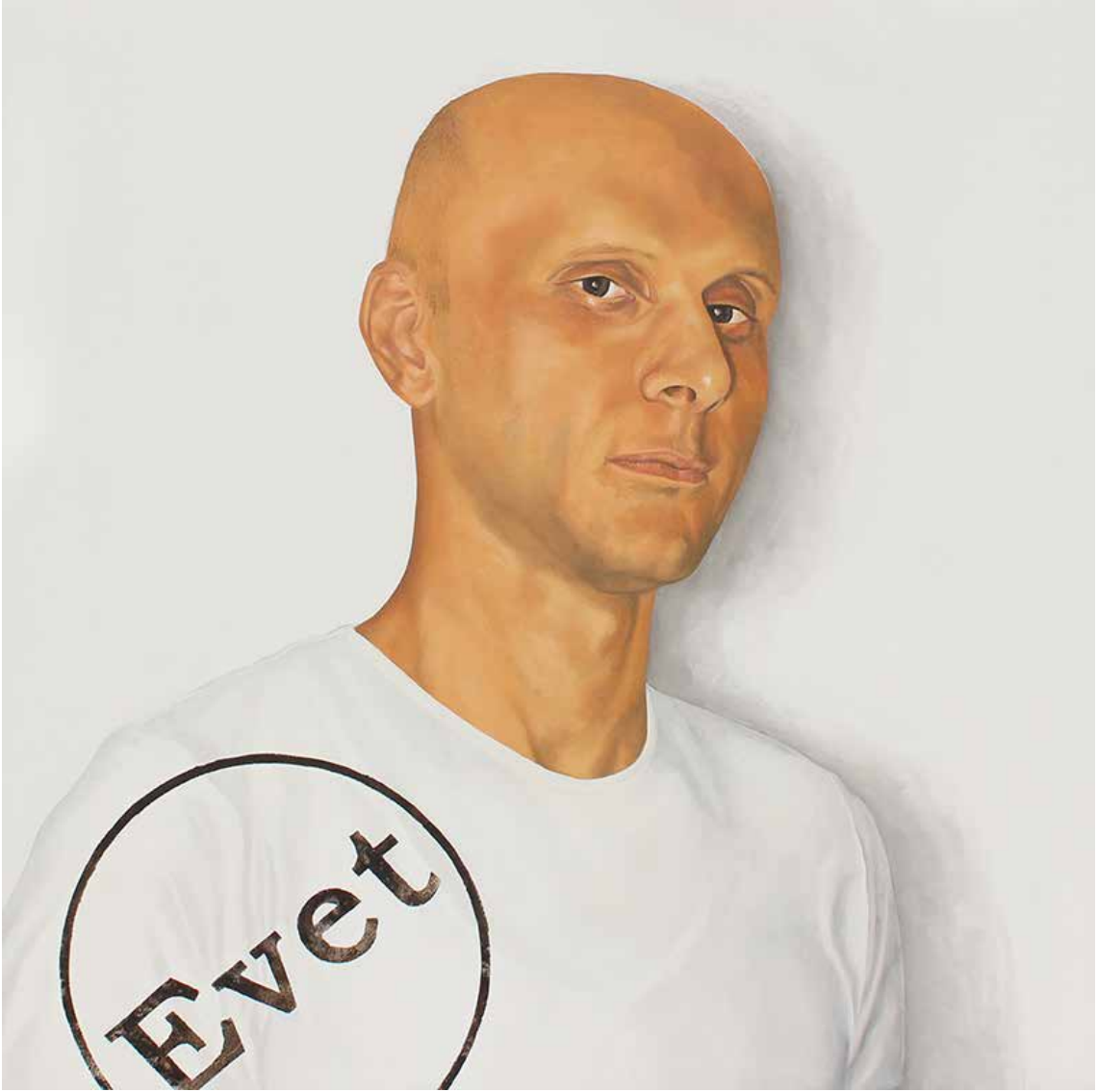
"SENİN SEÇİMİN KİM?", 100x100 cm, Tuval Üstüne Yağlıboya, 2015. "WHO IS YOUR CHOICE?", 100x100 cm, Oil On Canvas, 2015.