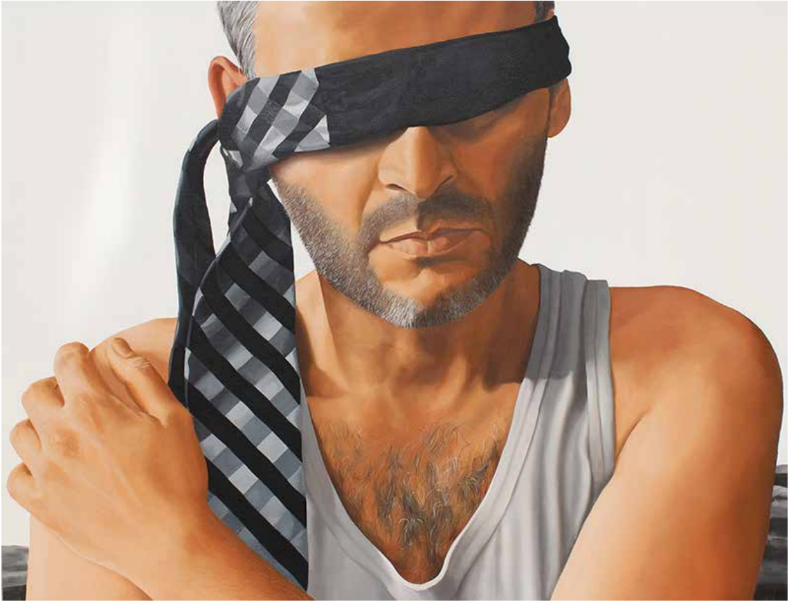
"TANIK 2", 100x150 cm, Tuval Üstüne Yağlıboya, 2015. "THE Witness 2" 100x150 cm, Oil On Canvas, 2015.