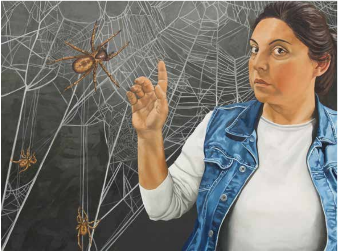
"DİŐİ KAHRAMAN", 100X130 cm, Tuval Üstüne Yađlıboya, 2015. "THE HEROINE", 100X130 cm, Oil On Canvas, 2015.