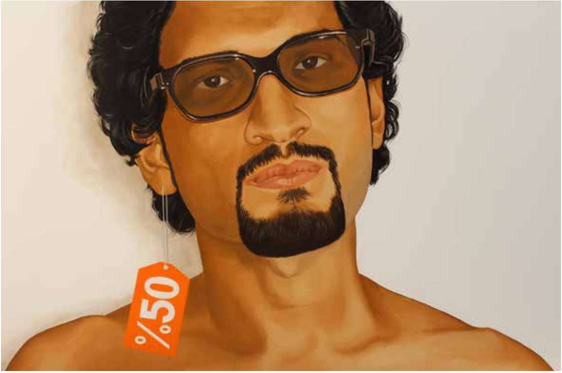
"ENTELLEKTÜEL BAYKUŞ", 100x150 cm, Tuval Üstüne Yağlıboya, 2015. "THEINTELLECTUAL OWL", 100x150 cm, Oil On Canvas, 2015.