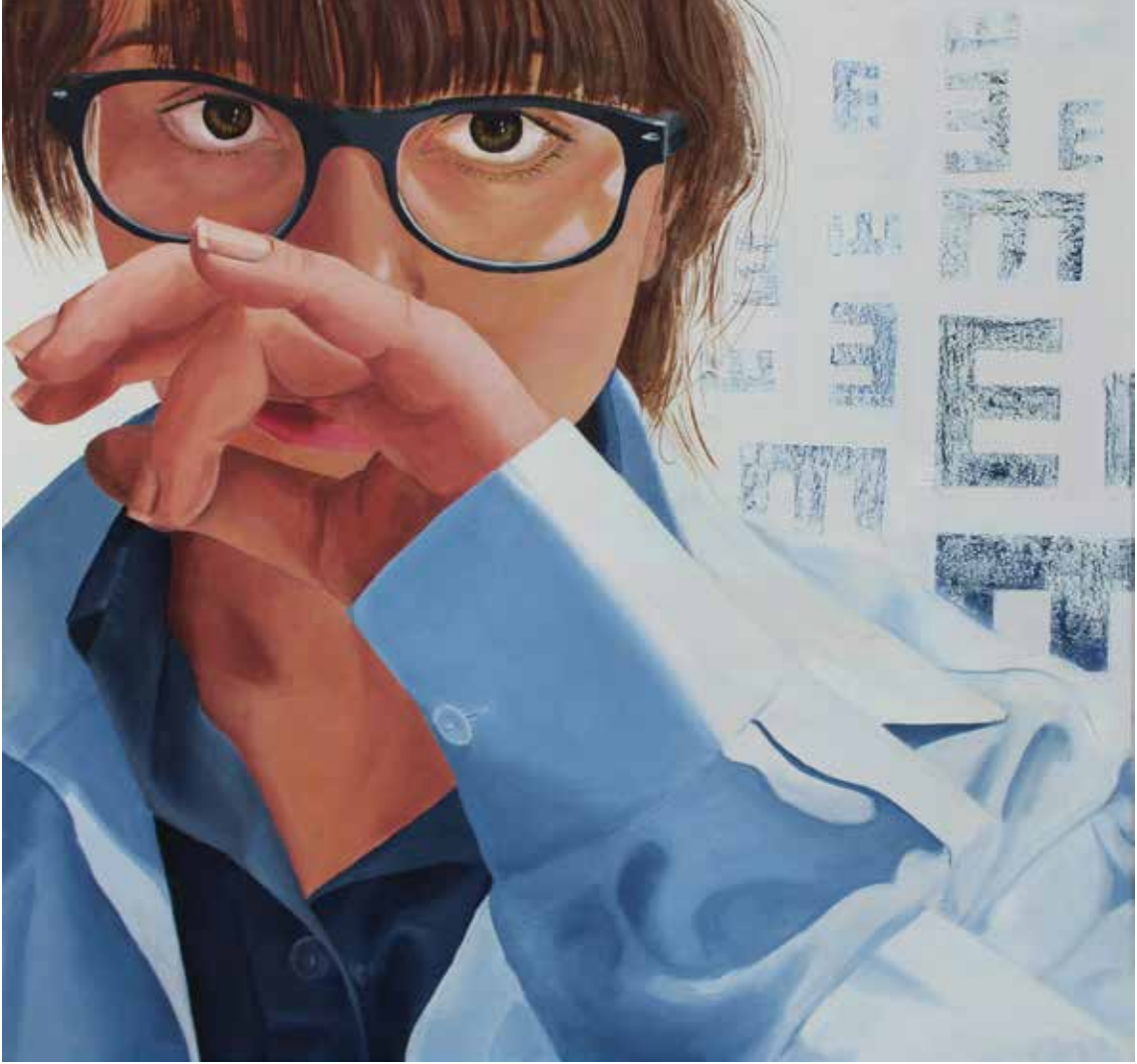
"GÖZ EŞELİ", 80x80 cm, Tuval Üstüne Yağlıboya, 2014. "THE EYE CHART", 80x80 cm, Oil On Canvas, 2014.