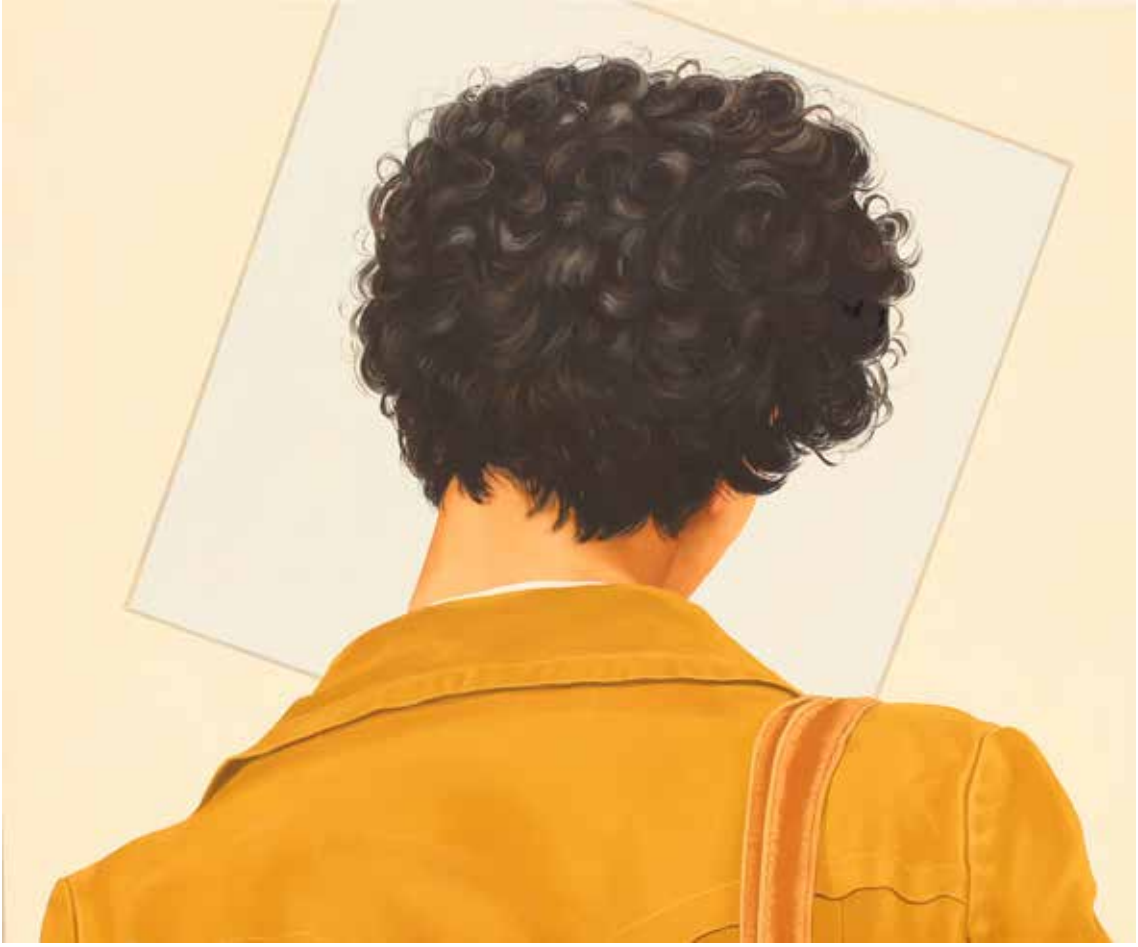
"MALEVİÇ'İN NESNESİ", 100x120 cm, Tuval Üstüne Yağlıboya, 2015. "MALEVİÇ'S OBJECT ", 100x120 cm, OilOn Canvas, 2015.