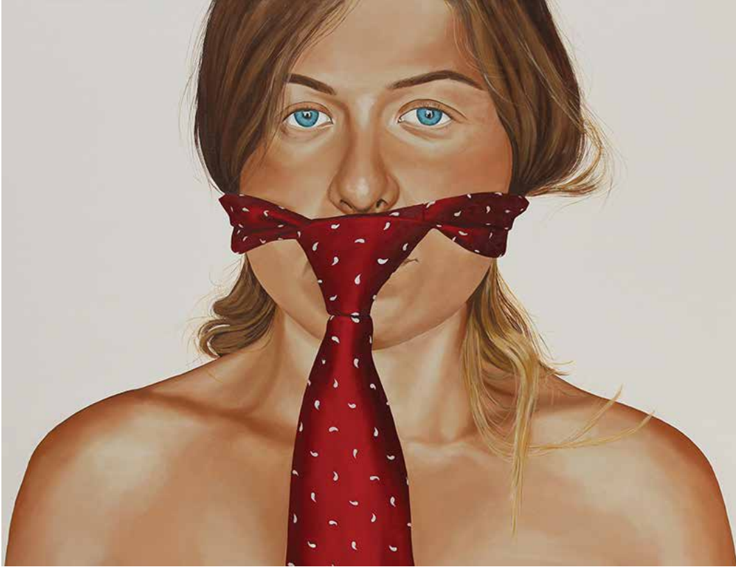
“TANIK 1”, 100x150 cm, Tuval Üstüne Yağlıboya, 2015. “THE Witness 1” 100x150 cm, Oil On Canvas, 2015.