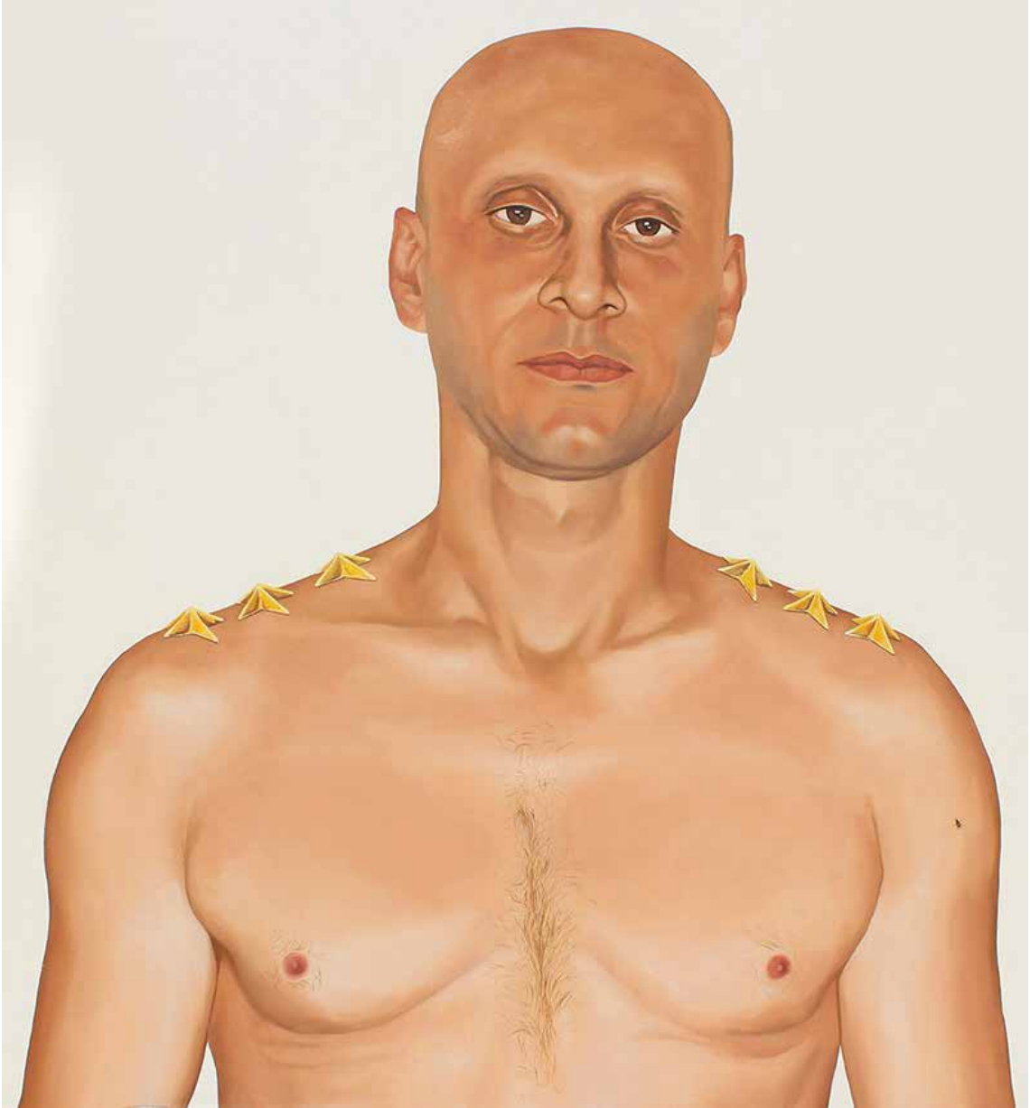
"STATÜ", 120x130 cm, Tuval Üstüne Yağlıboya, 2015. "DIGNITY", 120x130 cm, Oil On Canvas, 2015.