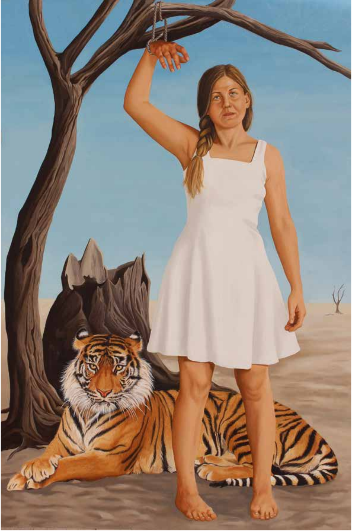
"GÜÇ", 100x150 cm, Tuval Üstüne Yağlıboya, 2015. "POWER", 100x150 cm, Oil On Canvas, 2015.