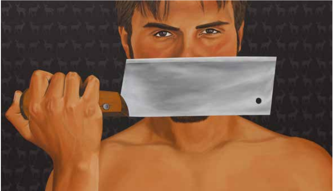
"EGO", 100x170 cm, Tuval Üstüne Yağlıboya, 2015.