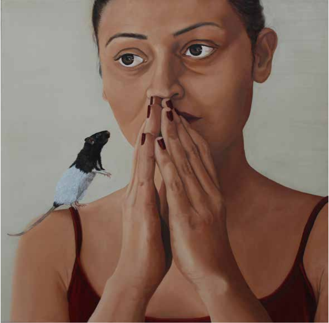
"MİSAFİR", 70x70 cm, Tuval Üstüne Yağlıboya, 2015. "THE VISITOR", 70x70 cm, Oil On Canvas, 2015.