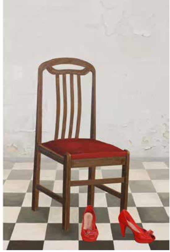
"EMANET", 120x180 cm 2 adet, Tuval Üstüne Yağlıboya, 2015. "TRUST", 120x180 cm 2 Canvas, Oil On Canvas, 2015.