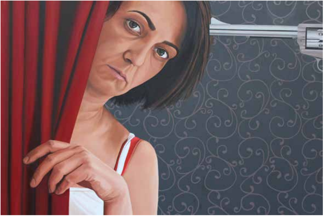
“SUÇ ORTAĞI”, 100x150 cm, Tuval Üstüne Yağlıboya, 2015. “THE ACCOMPLICE”, 100x150 cm, Oil On Canvas, 2015.