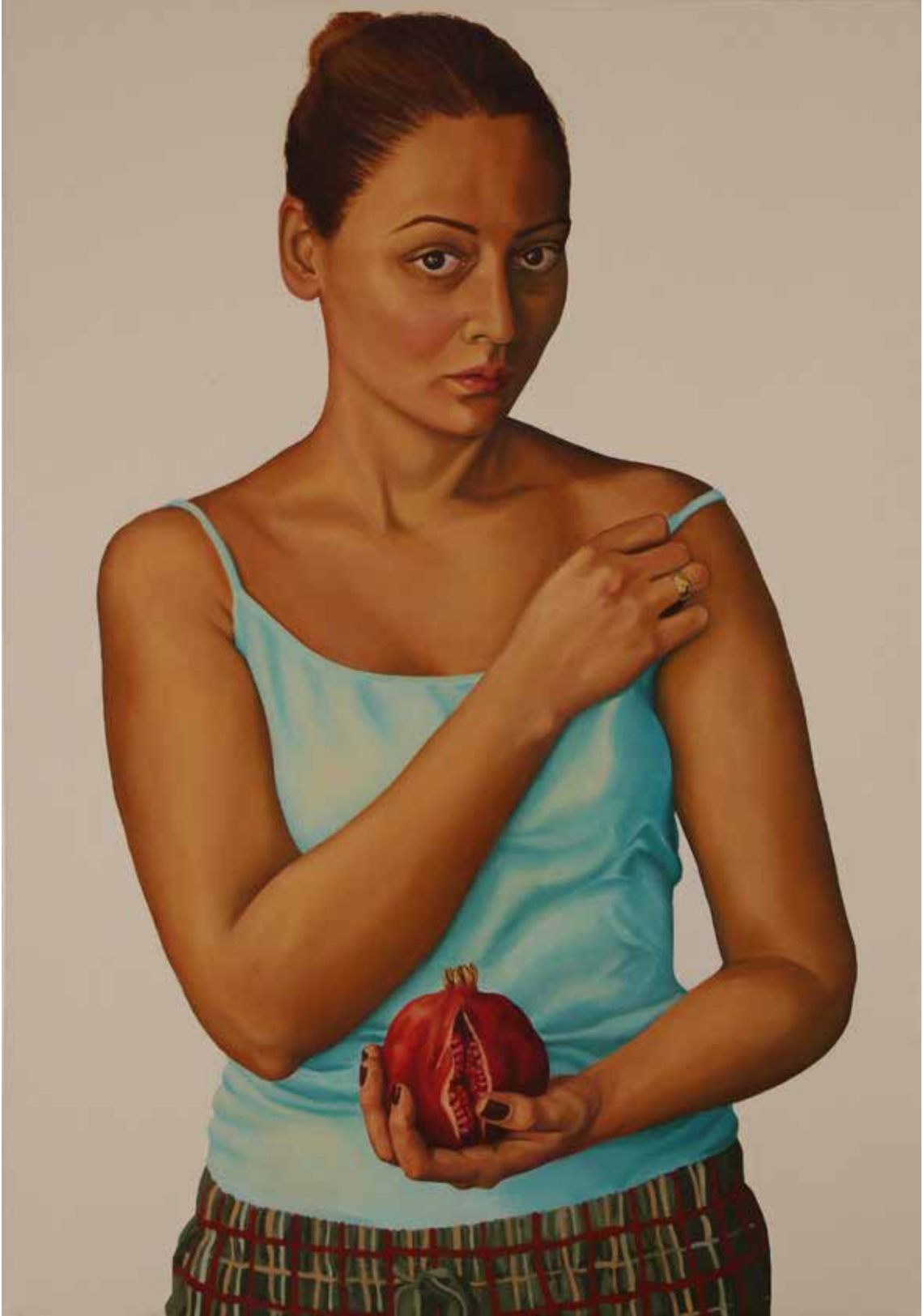
"TANRIÇA", 90x130 cm, Tuval Üstüne Yağlıboya, 2015. "GODDESS", 90x130 cm, Oil On Canvas, 2015.