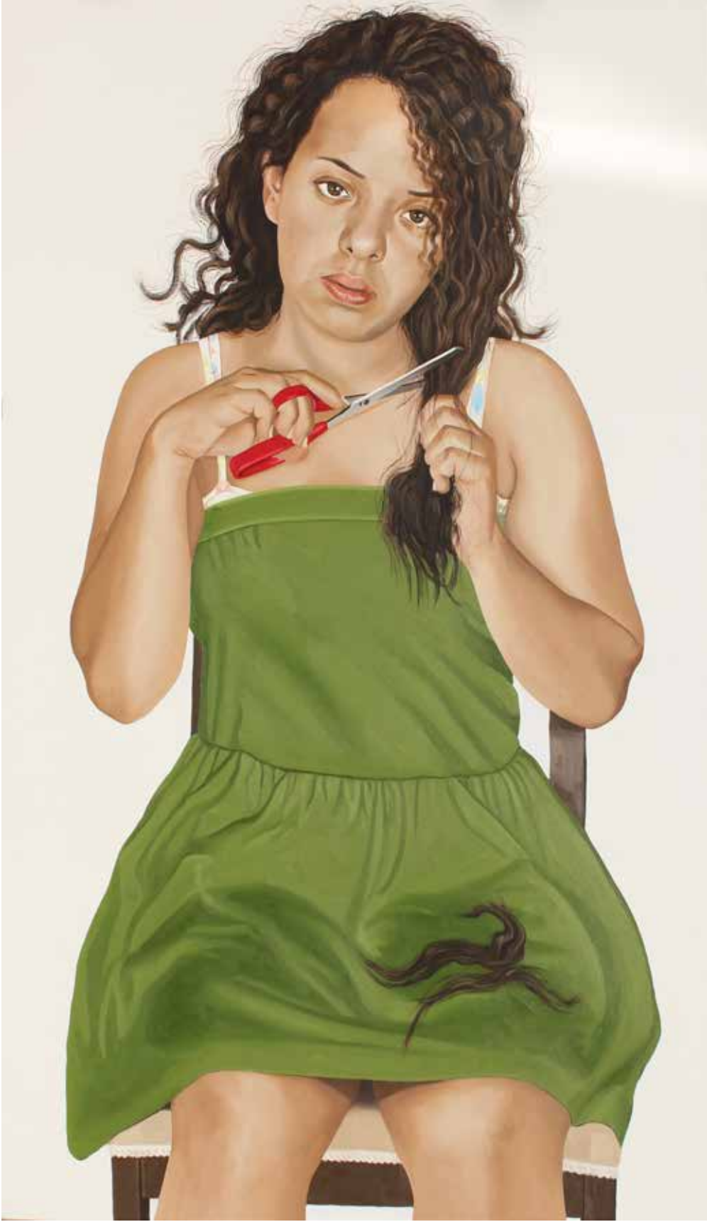
"ÖZGE 17 YAŞINDA", 100x170 cm, Tuval Üstüne Yağlıboya, 2015. "ÖZGE IS 17 YEARS OLD" 100x170 cm, Oil On Canvas, 2015.