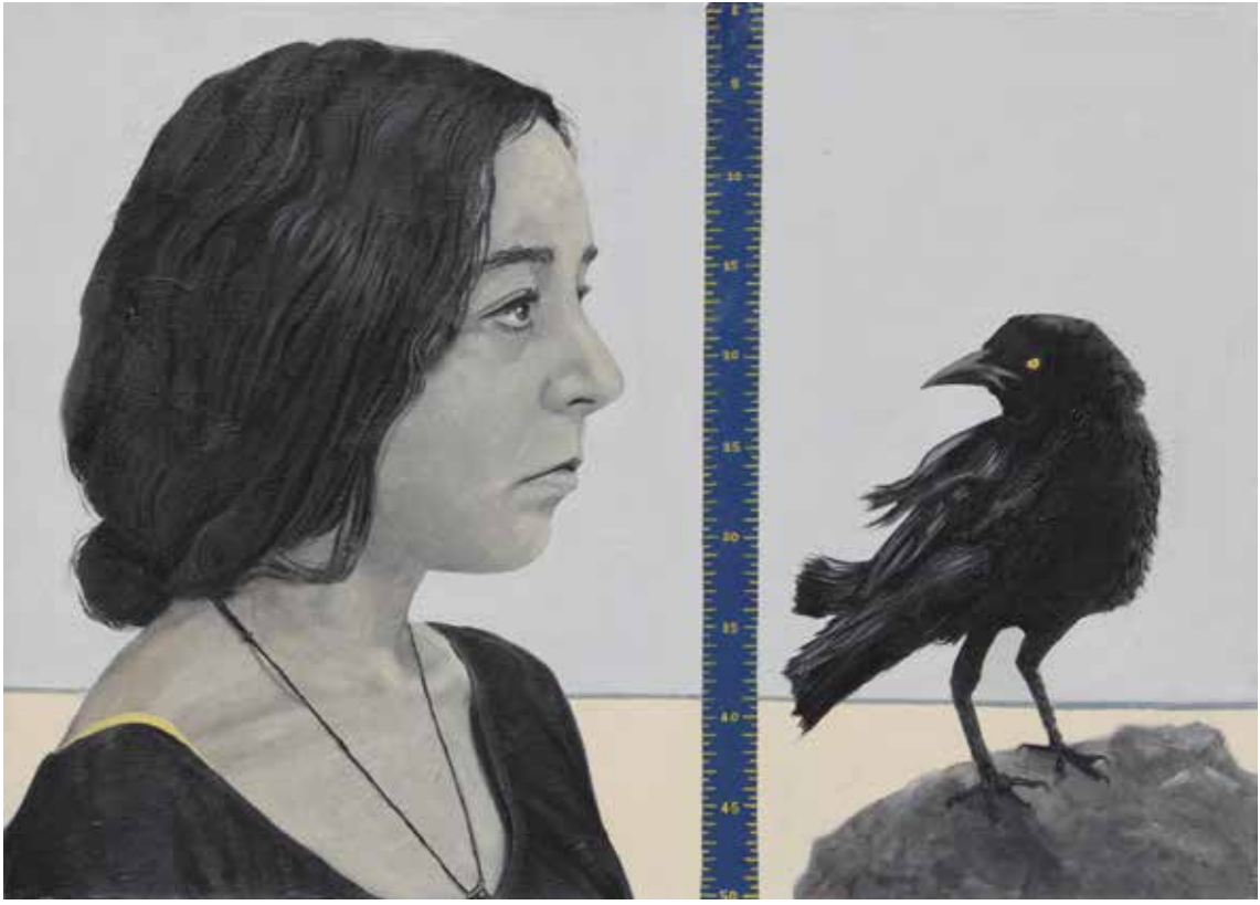
"HESAPLAŞMA", 50x70 cm, Tuval Üstüne Yağlıboya, 2014. "THE SHOWDOWN", 50x70 cm, Oil On Canvas, 2014.