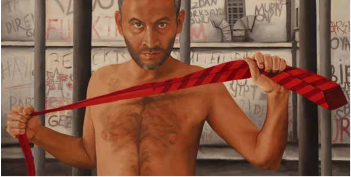
"PROTESTO", 75x150 cm, Tuval Üstüne Yağlıboya, 2015. "THE OPPOSITION", 75x150 cm, Oil On Canvas, 2015.