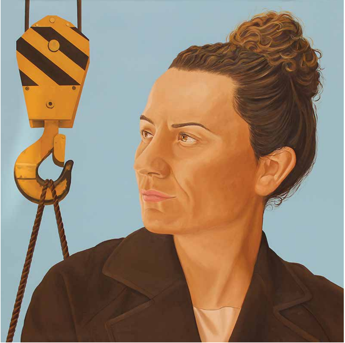
"DİRENÇ", 130x130 cm, Tuval Üstüne Yağlıboya, 2014. "THE RESISTANCE", 130x130 cm, Oil On Canvas, 2014.