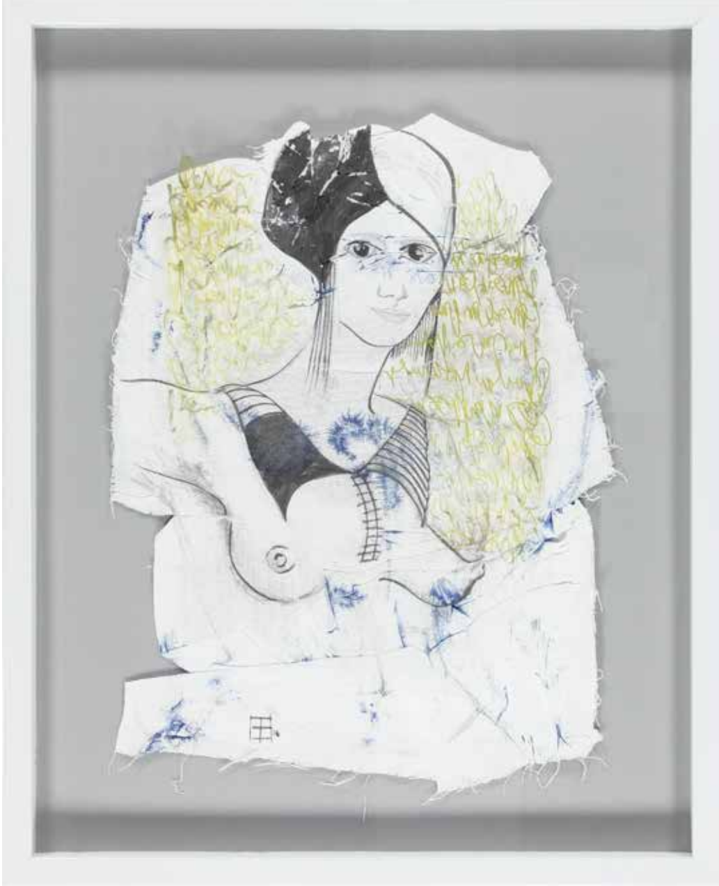
LEYDİM, SEN NEYDİN? 49X61cm, Karışık teknik, 2016

GERİLDİM, ESNEĐİM... SENİ İÇİMDEN ÇIKARDIM. DOĐUMUN ÖLÜME VERĐİĐİN SÖZÜNDÜ AYNI ZAMANDA.