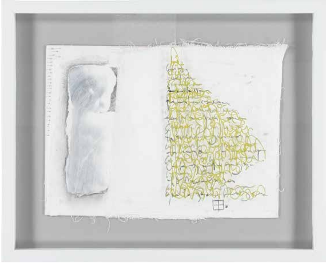
İÇİME OTURDU BAKIŞIN 52X42 cm, Karışık teknik, 2016