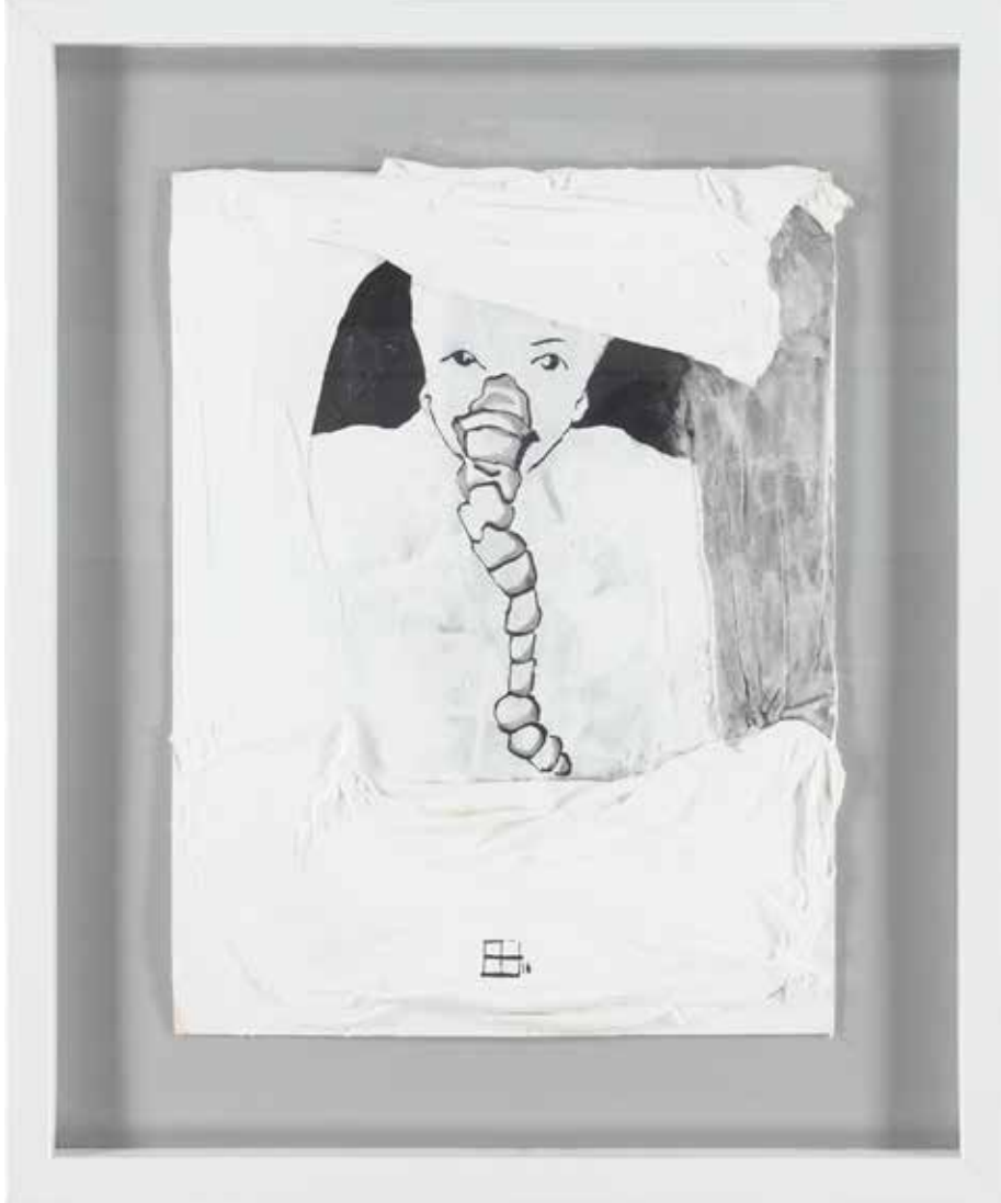
HADDAD 43,5X52,5 cm, Karışık teknik, 2016

ZOR ZAMANLARDI... TAHTTAN İNMEK DEĞİLSEDE, İDRAKINA VARMAK ZORDU. OYSA HEPİMİZ BİR DÖNÜŞÜN İÇİNDEYDİK, VE EN ÇOK DA KENDİMİZE DÖNÜYORDUK.