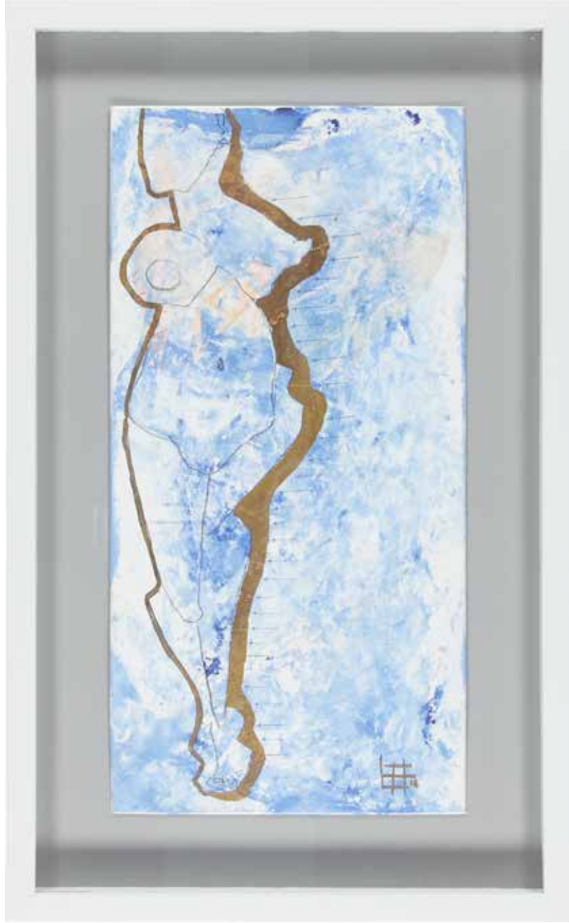
BU DURUŞUMU SANA BORÇLUYUM-2 38X62,5 cm, Karışık teknik, 2016