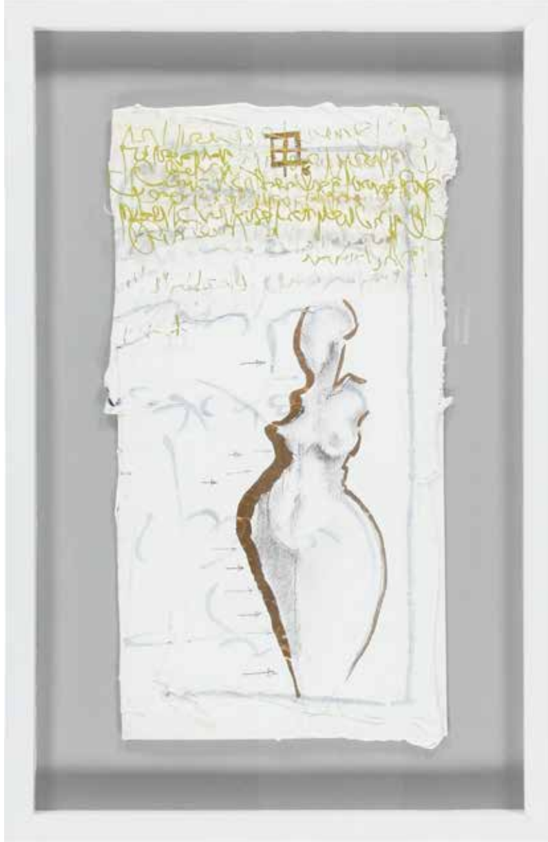
FERHAD 38X58,5 cm, Karışık teknik, 2016

HADDAD KENDİNE GİDEN YOLDA KARŞISINA ÇIKAN DAĞI DELDİ. GÖREV ZOR VE ESASTI. BAŞARDI!