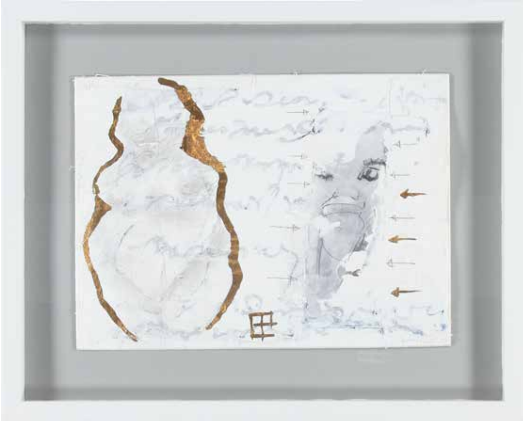
AŞKATEŞİ 51X41 cm, Karışık teknik, 2016

KUVVETLİ RÜZGARLARDA DİK DURMAK DERİN SULARDA SU ÜSTÜNDE KALMAK SENİN SAYENDE... BU DİK VE SAĞLAM DURUŞUMU SANA BORÇLUYUM!