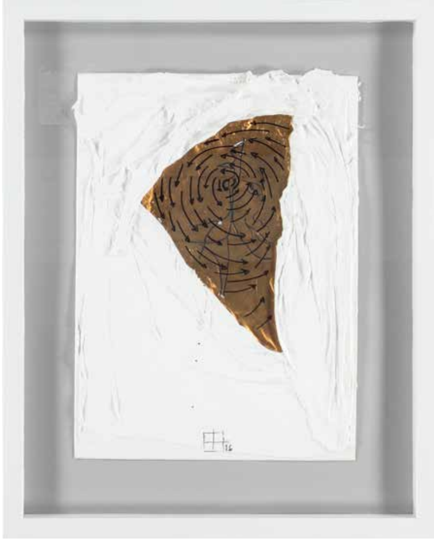
HERŞEY ASLINA RÜCU EDER 41X51 cm, Karışık teknik, 2016