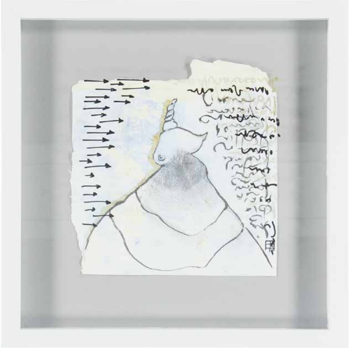
AH MİNEL AŞK 35X37,5 cm, Karışık teknik, 2016